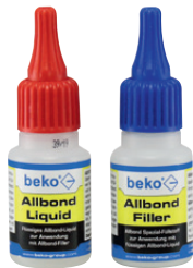
Liquid 20 g + Filler 20 g Art.-Nr. 261 7 20