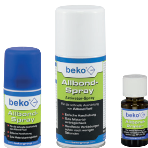
30 ml Art.-Nr. 261 30 150 ml Art.-Nr. 261 150 15 ml Art.-Nr. 261 1 15