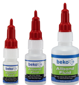
10 g Art.-Nr. 261 10 20 g Art.-Nr. 261 20 50 g Art.-Nr. 261 50